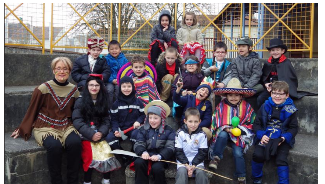
■ De superbes déguisements.

filé aux alentours de l'établissement scolaire