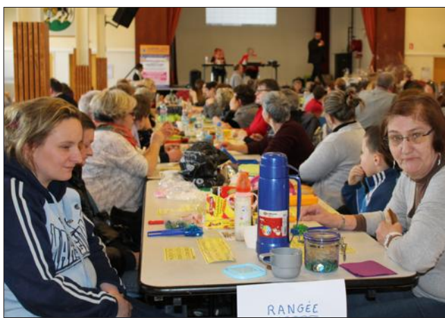
■ Une belle salle pour cet élan de solidarité.