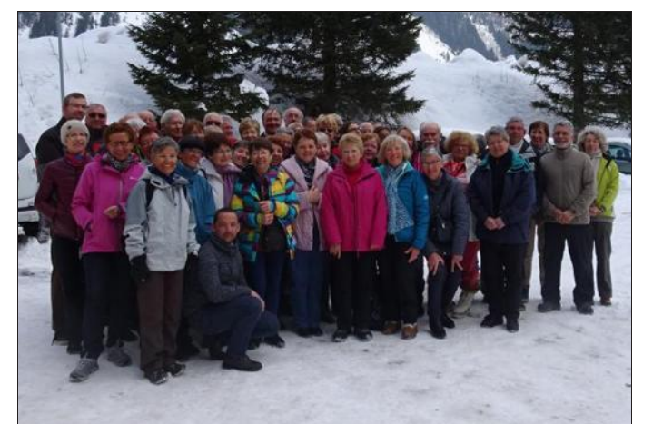
■ La neige était au rendez-vous.

Le groupe, hébergé au centre Vacancier de Pralognan, y a particulièrement apprécié la proximité des pistes et des chemins de randonnées, sans oublier la qualité de la restauration.