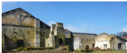
19 mars 2019