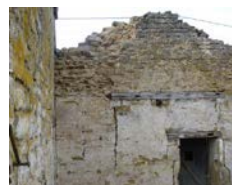
22 septembre 2019