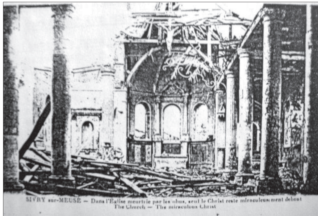
■ En 1916, dans l'église meurtrie, seul le Christ est miraculeusement resté debout.

Après le conflit, les travaux de réfection sont confiés à l'architecte Lagesse, les gros œuvre et la reconstitution des autels à l'entreprise Hory, le pavé à Cadario Ago-